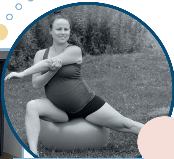
MOUVEMENTS ET BALLON PRÉNATAL